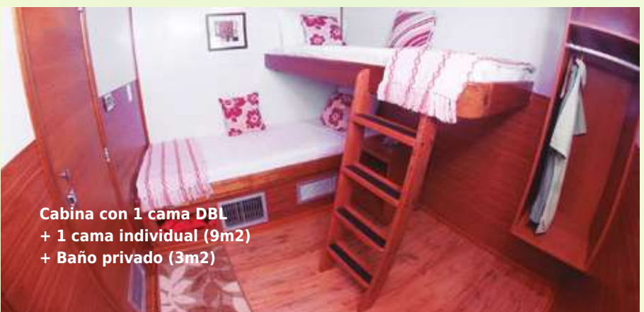
Cabina con 1 cama DBL + 1 cama individual (9m 2 ) + Baño privado (3m 2 )