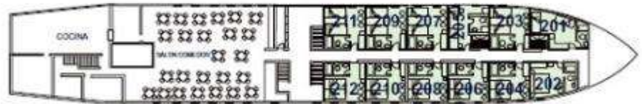
CUBIERTA ACROPOLIS / ACROPOLIS DECK