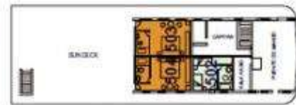
CUBIERTA ATHOS / ATHOS DECK