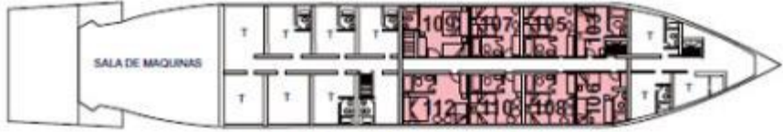
CUBIERTA ATENAS / ATHENS DECK