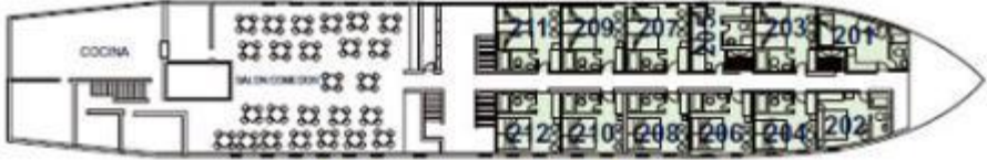
CUBIERTA ACROPOLIS / ACROPOLIS DECK